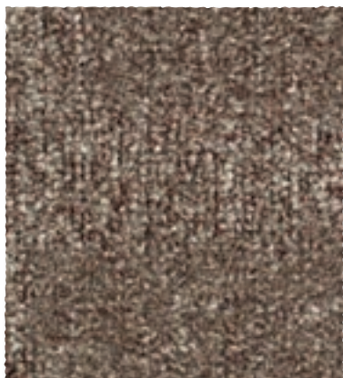
Block / Park / Track 760