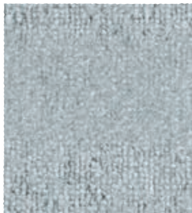
Block / Park / Track 910