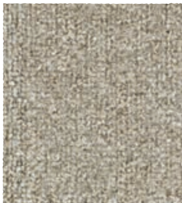
Block / Park / Track 610