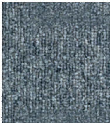
Block / Park / Track 960