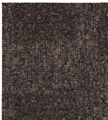
Block / Park / Track 790