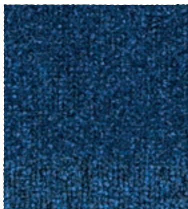
Block / Park / Track 180