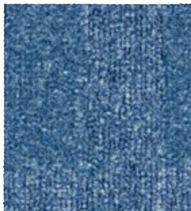
Block / Park / Track 160