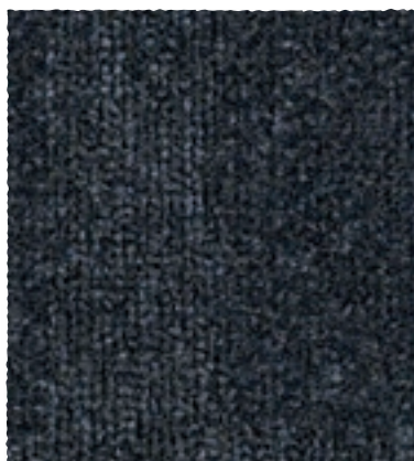
Block / Park / Track 990